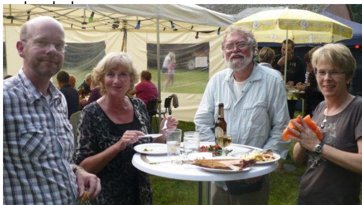
Es hat sichtlich geschmeckt...

Am frühen Abend kamen die ersten Besucher und ließen sich die leckeren geräucherten Forellen, frische Bratwurst und selbstgemachte Salate schmecken. Ein kühles Bier, ein Gläschen Wein oder