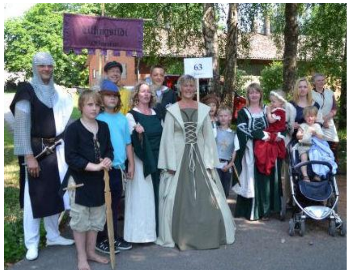
Die mit dem 1. Preis ausgezeichnete Offenser Fußgruppe

Der Tag des Umzugs war einer der wenigen heißen Tage im Sommer 2011. Bei über 30 Grad im Schatten schwitzten alle Teilnehmer in ihren Kostümen. So zogen die Offenser mit Kettenhemd und mittelalterlichen Kleidern und Gewändern bekleidet mitsamt den 20 Schafen und Ziegen, Schäfer, Trecker und Milchwagen durch die Heeslinger Straßen, bejubelt von unzähligen Schaulustigen und bewertet von diversen Juroren, sollten doch am Ende die besten Gruppen ausgezeichnet werden. Keiner der