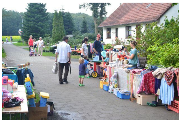
Noch hält das Wetter...

Der diesjährige Straßenflohmarkt „Am Bogen“ fand am 26. August erstmals als Abendflohmarkt statt. Diverse Stände verwandelten die Straße in eine kleine Bummelmeile. Doch das Wetter meinte es diesmal nicht gut. Kurz nach Beginn um 17 Uhr ging ein kräftiger Gewitterregen nieder und veranlasste manch einen Standbesitzer zu fluchtartigem Abbau, um seine Schätze und sich selbst ins Trockene zu bringen. Auch wenn einige Hartgesottene durchhielten, der erhoffte Besucherstrom wurde durch den Regen abgehalten. Trotzdem ist der Flohmarkt mittlerweile eine feste Größe im Offenser Veranstaltungskalender und wird sicherlich auch 2012 wieder Besucher anziehen.